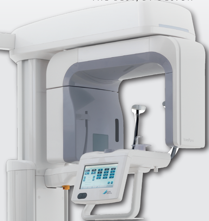
Vista Pano S