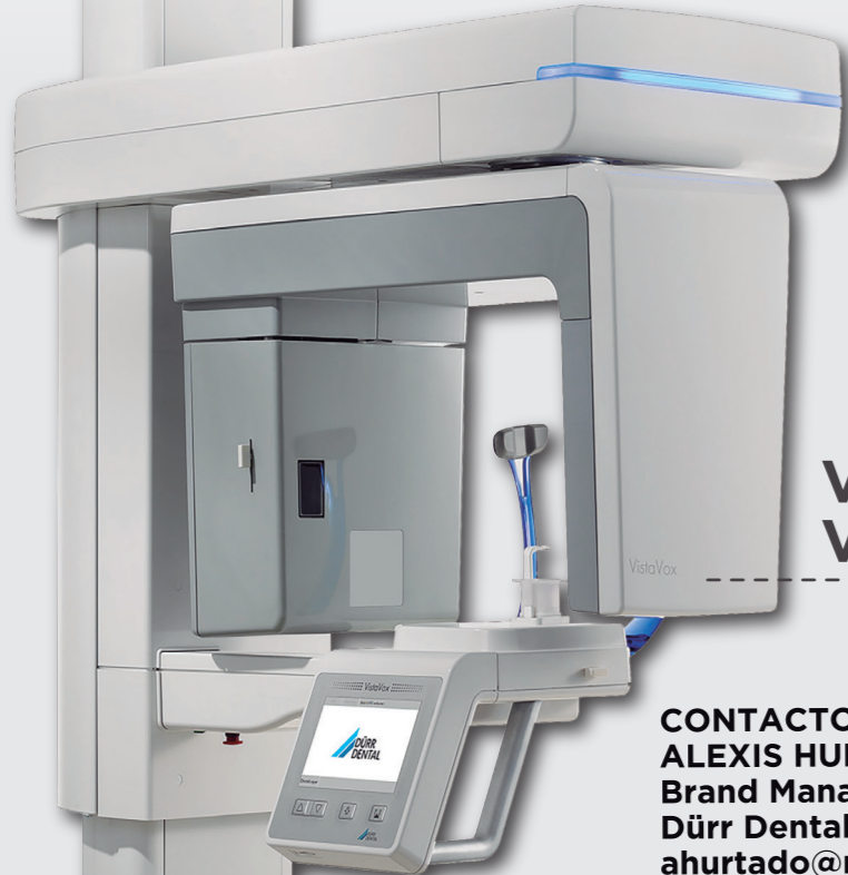
Vista Vox S